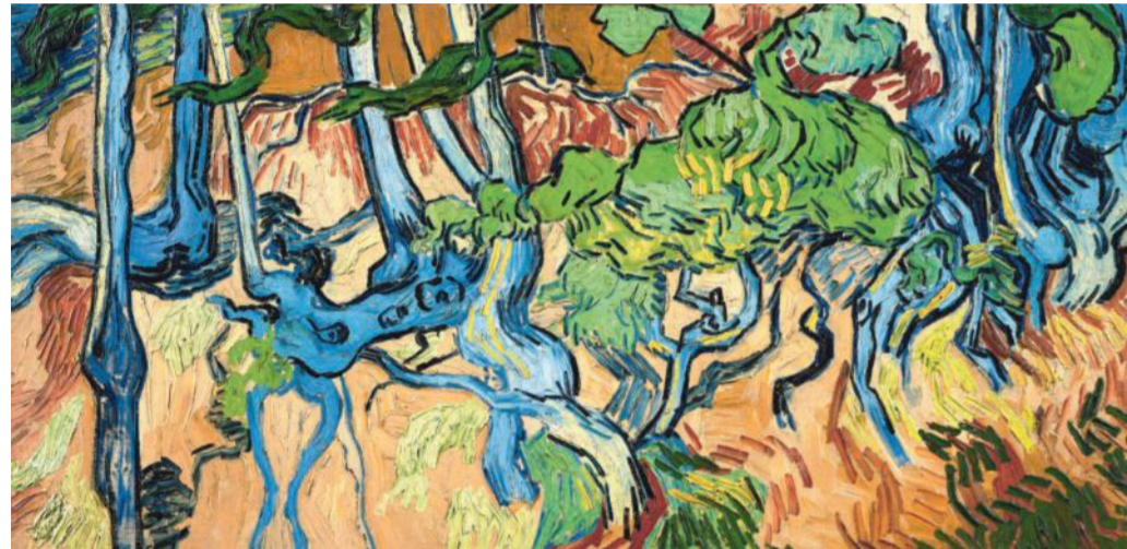
Vincent van Goghs laatste schilderij: Boomwortels , 27 juli 1890 (olieverf op doek, 50,3 x 100,1 cm.)