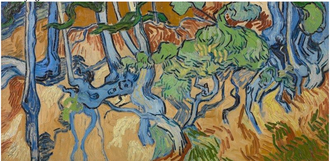
Vincent van Goghs laatste schilderij: 'Boomwortels', 27 juli 1890 (olieverf op doek, 50,3 × 100,1 cm.) Collectie Van Gogh Museum, Amsterdam