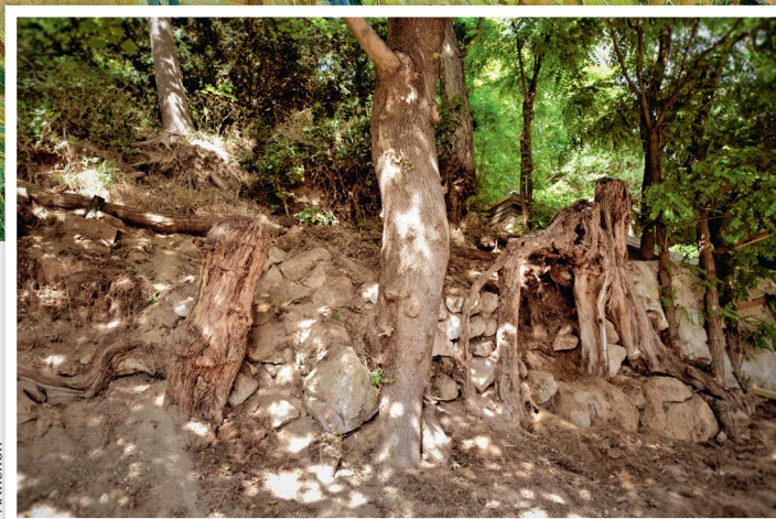
Vincent van Gogh, Les Racines , 27 juli 1890. Collectie Van Gogh Museum, Amsterdam. In de inzet: de exacte locatie, 130 jaar later.