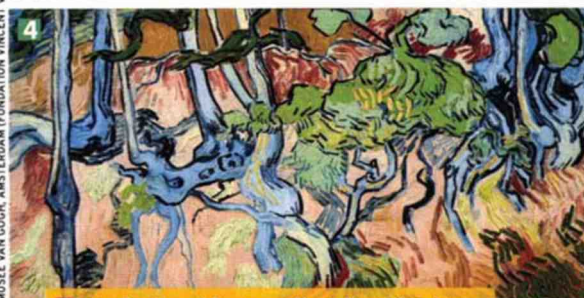
MUSÉE VAN GOGH, AMSTERDAM (FONDATION VINCENT VAN GOGH)

1 La rue Daubigny, à Auvers-sur-Oise, telle qu'elle existe aujourd'hui. 2 Cette carte postale nous la montre vers 1900. 3 On devine ici, en surimpression, le motif que Vincent Van Gogh a reproduit. 4 Ce chef-d'œuvre est aussi la dernière toile de l'artiste.