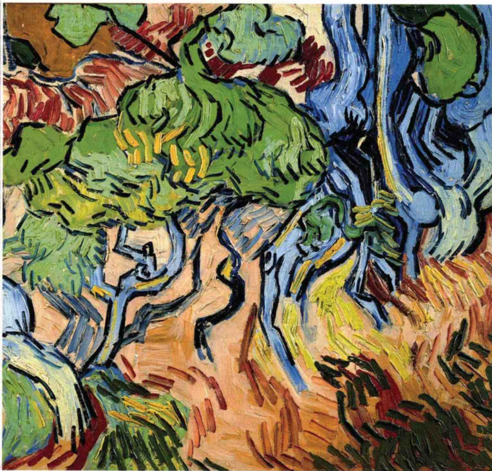
MUSÉE VAN GOGH, AMSTERDAM (FONDATION VINCENT VAN GOGH)

De l'absence de dessin principal. Tout est traité sur le même plan, avec des superpositions de grands aplats de couleurs et de touches éclatées. Il y en a partout, sans hiérarchie. Van Gogh s'affranchit de tous les codes figuratifs traditionnels, jusqu'à frôler l'abstraction. En prime, il adopte un format panoramique (50 x 100 cm), appelé aussi double carré, qui nous offre un point de vue grossissant sur ce minuscule paysage. Du coup, ce dernier prend l'aspect d'une nature quasiment monstrueuse ! Et nous voici littéralement plongés dans le motif, le regard prisonnier de ce réseau complexe et envahissant de fûts et de racines.